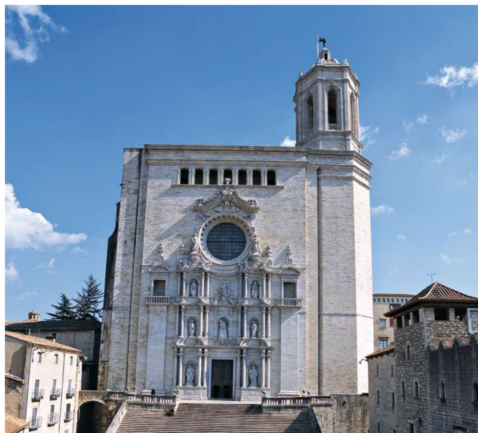
► Escalinata y fachada principal de la Catedral de Girona

Una de sus mayores virtudes es que tienen un precio muy competitivo por lo que la relación calidad precio es fantástica.