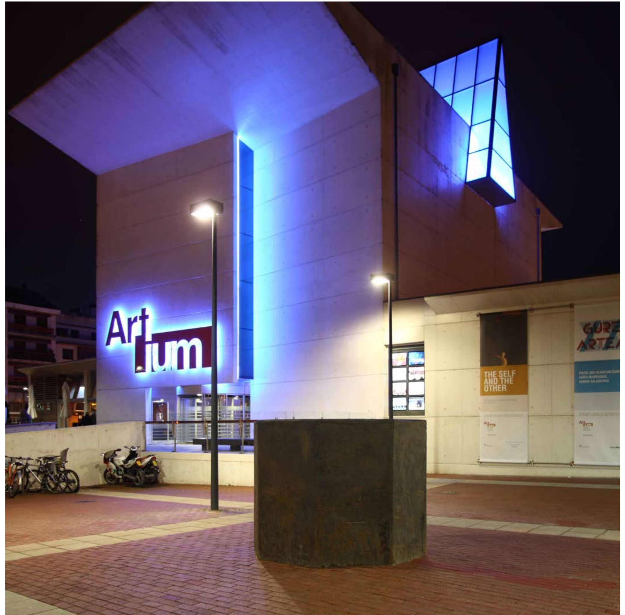
Fachada principal de Artium ►